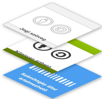
1. ábra. A CC licenszek 3 rétege