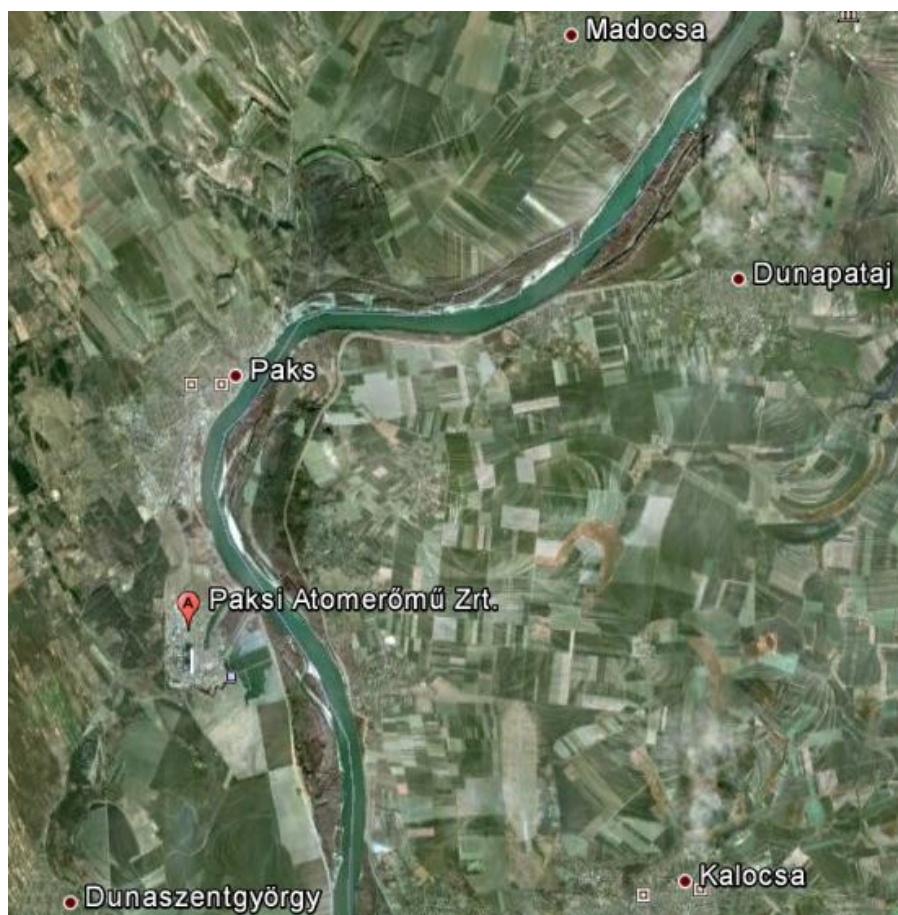
2. ábra: A Paksi Atomerőmű Zrt. és a környező települések