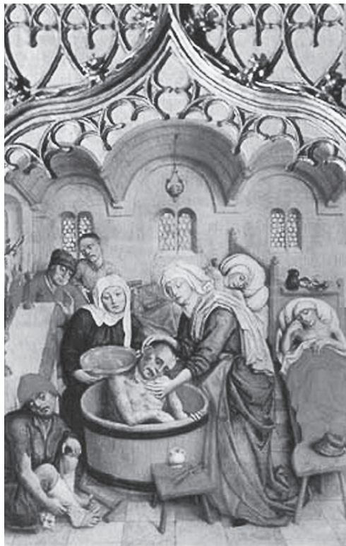
2. kép. Szent Erzsébet betegeket gondoz (A kassai dóm főoltárának részlete, 1474/1477, MAJOROSSY–SZENDE 2008. 282. nyomán)

A szentek tisztelete, majd pedig a szentkultusból kifejlődő peregrinatio a korai időszaktól kezdve fontos eleme a keresztény hitéletnek. Magától értetődő tehát, hogy a tehető családok tagjai körében a közeli és távoli kegyhelyek felkeresése korszakunkban is a devóció általánosan megszokott formái közé tartozott. 56 A hitbéli megerősödés, áhítatgyakorlat, búcsúnyerés, valamint a családi tradíció mellett a zarándoklat kiváló lehetőséget biztosított az információszerezésre, lovagi tettek végrehajtására, valamint a reprezentációra is, melyet a mágnások igyekeztek kihasználni. Különösen a keresztény kultuszközpontokba, Rómába, a Szentföldre és Santiago de Compostelába irányuló főúri búcsújárások alkalmával figyelhető meg a vallásos és a világi attitűd együttes jelenléte, kon-