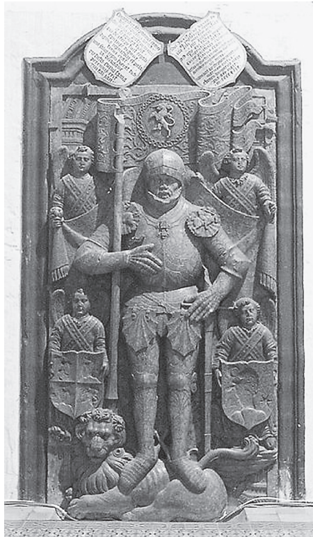
4. kép. Szapolyai István síremléke (1499, Magyar Nemzeti Múzeum)

talán legismertebb példája a Szapolyai István síremlékén elhelyezett vers, mely a következőket hirdette büszkén az utókornak: „Ez a sír István szepesi ispánt takarja / aki a haza díszére ezernyi győzelmet aratott / aki méltó volt királyi törzsből származó feleségre / aki az országalakók szemében megérdemelten lett nádor. Együtt volt az ország üdve, az erény védelmezése és becsülete / melynek híre örökké fenn fog maradni. / Aki becstelenül éli dicstelen életét / az halálát súlyos dologként fogja megélni. / De én, aki a kalendáriumot hatalmas cselekedetekkel töltöttem meg / és aki a nádorság magasságában lettem híres / örülök annak, ha a végzet magasba emeli az erényekre büszke lelkeket / és a dolgok rendje szerint a bátor férfiak elmennek. / Mert bár a márvány alatt itt nyugszik István vitézsége / mégis fényesen él tovább a magyar ég alatt.” 86