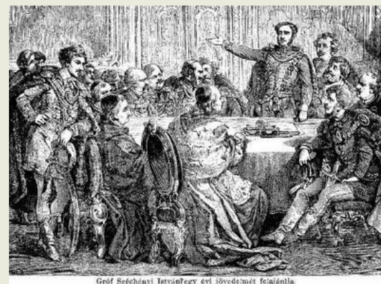
Gróf Széchenyi István egy évi jövedelmét felajánlja.